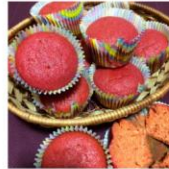
Bolinho Rosa de Beterraba