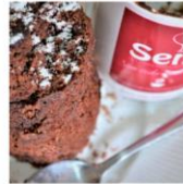
Bolo de Caneca