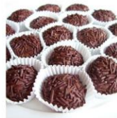
Brigadeiro de leite de arroz