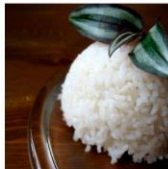
Arroz com leite de coco