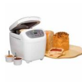
Pão com Polvilho Doce (Máquina de Fazer Pão)