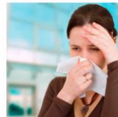
Alergia, sensibilidade e intolerância alimentar: qual a diferença?