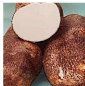
Creme de Cará com Shitake