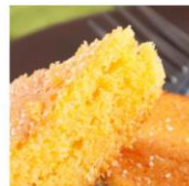
Bolo de Fubá