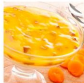
Sobremesa Damascos com Chocolate