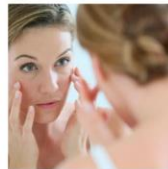
Colágeno Todo Dia: Por Que Você Precisa?