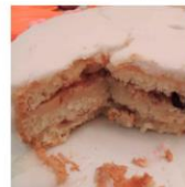
Bolo de Festa com Creme, Nozes e Ameixa