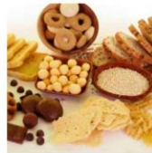
Dieta Sem Glúten E Suas Evidências Científicas