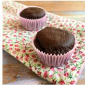
Muffin Proteico de Cacau com Coco