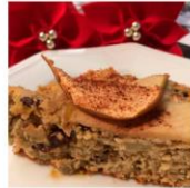
Bolo Natalino sem farinha e sem açúcar